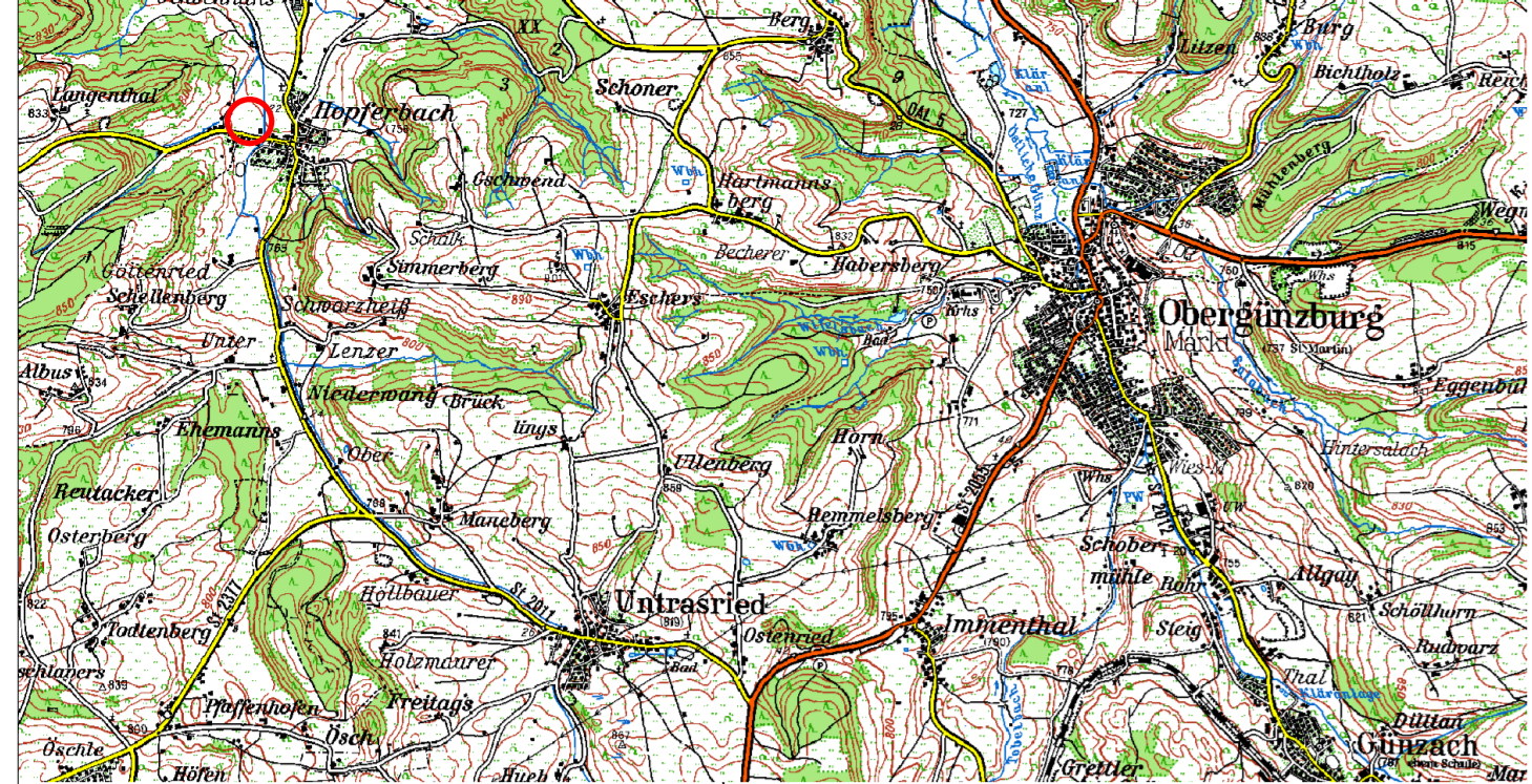
Auszug aus der Topographischen Karte ohne Maßstab