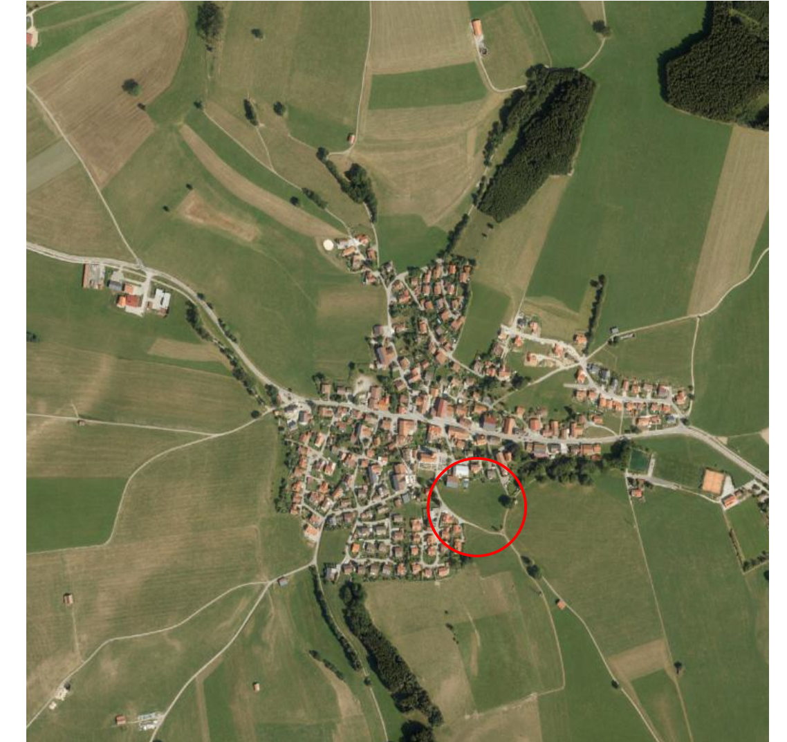
Ausschnitt Luftbild unmaßstäblich