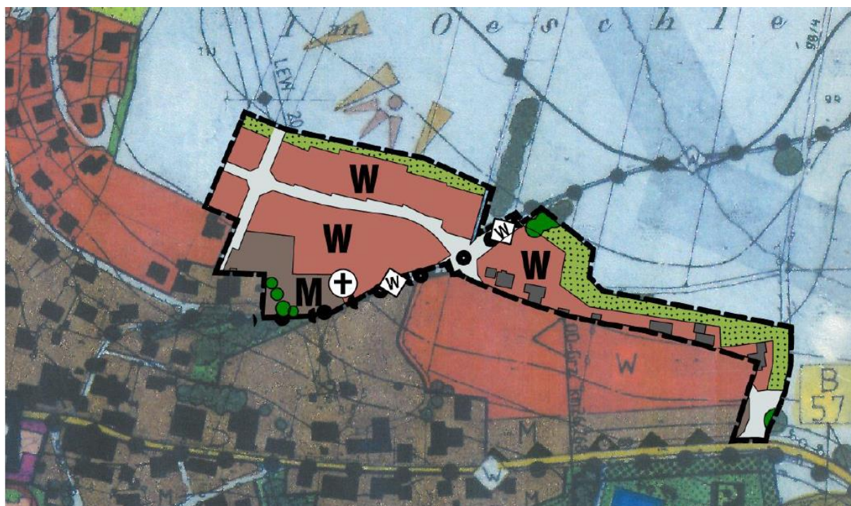
Auszug 2. Flächennutzungsplanänderung